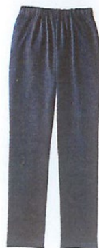
S~LL 共通 チャコールグレー