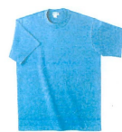
L: ターコイズブルー